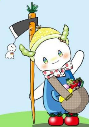
イメージキャラクター 「みらいちゃん」