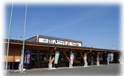
いーなとうぶ竜王